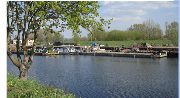
Przedsięwzięcie 2.1.1 w ramach Lokalnej Strategii Rozwoju na lata 2014-2020

Budowa lub przebudowa Infrastruktury turystycznej i rekreacyjnej na obszarze LSR do 2023 r.